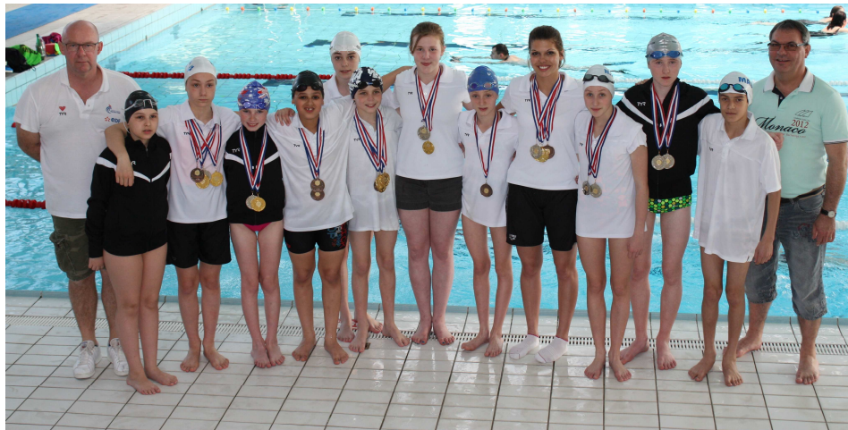
L'équipe ELITE, 5 ème Challenge de la côte d'Albâtre 2015

Chronométrage OMEGA Bassin de 25 m – 6 couloirs Bassin de récupération Piscine du Littoral – St VALERY en CAUX